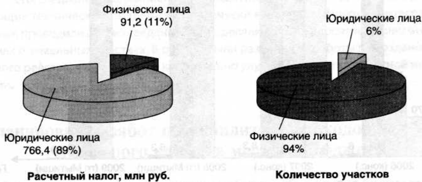
Рис. 1 Структура дохода

Анализ сведений о земельных участках выявил также и предполагаемую структуру дохода: 6% участков, принадлежащих юридическим лицам, обеспечивало 89% дохода в бюджет (рис. 1). В связи с этим было принято решение сосредоточить в 2006–2007 гг. все усилия на работе с юридическими лицами, а второй этап, работу с физическими лицами, – отнести на период 2008–2009 гг.